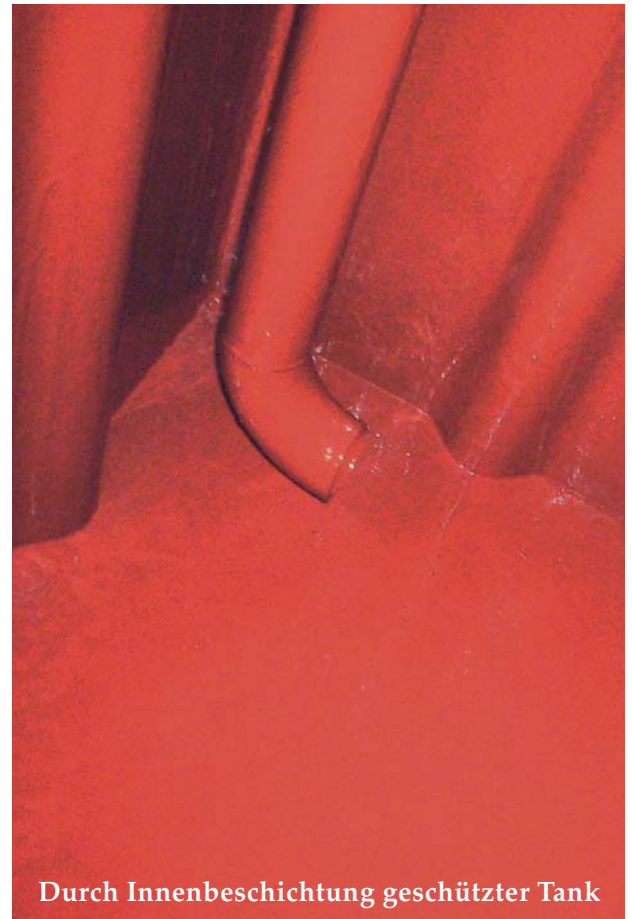
Durch Innenbeschichtung geschützter Tank

Die LAUDON Tankbeschichtung – Ihr sicherer Schutz vor Korrosion!