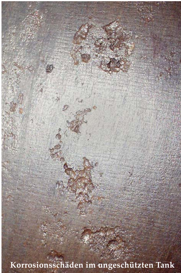
Korrosionsschäden im ungeschützten Tank