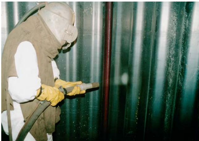
So wird ein Tank gesandstrahlt: Die Stahloberfläche wird von Rost befreit und aufgeraut, damit die Beschichtung später optimal haftet.

LAUDON ist Spezialist für Tankschutz seit 40 Jahren. Fragen Sie uns, wenn es um Ihren Tank geht!