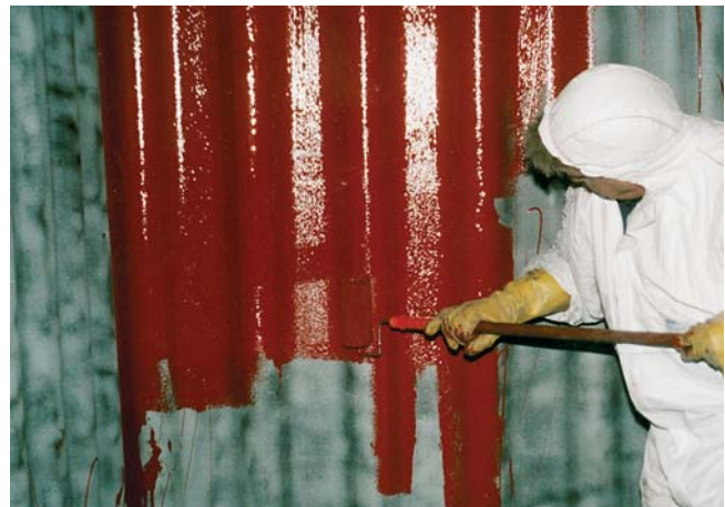
Unser Mitarbeiter trägt von Hand die Beschichtung auf – gründlicher Schutz für jahrelange Sicherheit. Jetzt hat der Rost keine Chance mehr.